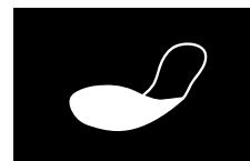
PLANTILLA ANTI- PERFORACIÓN TEXTIL