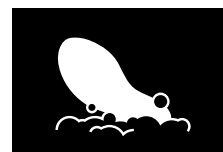
PLANTILLAS EXTRAÍBLES LAVABLES