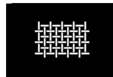
TEJIDO CORDURA MUY TRANSPIRABLE